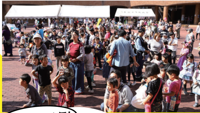
※写真は前回イベント風景です。

当日のイベント会場ではチケットのみの販売となります。 受付にてチケットをご購入くださいませ。(ウラ面に詳細)